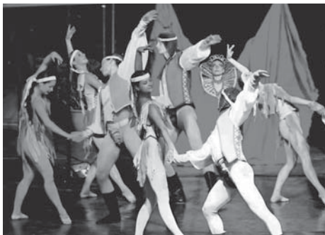
Die „Carmina Burana“ zeigt den Lebenszyklus