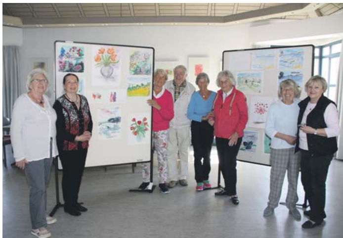
Stolz präsentierten die Teilnehmer der Aquarellmalgruppe ihre Lieblingsstücke im Gemeindehaus der evangelischen Friedenskirchengemeinde in der Bahnstraße.