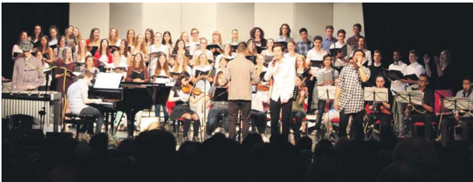
AES-Chöre stellen sich vor. Im fast vollbesetzten großen Saal des Bürgerhauses präsentierten sich am Dienstag vergangener Woche die Chöre und die Big Band der Albert-Einstein-Schule bei ihrem traditionellen Frühlingskonzert. Das Spektrum reichte vom lustigen „Hai im Kochtopf“ des Unterstufenchors bis zu Pharrell Williams' „Happy“, das der Oberstufenchor zusammen mit der Big Band vortrug. Von den Eltern gab es für das rund zweistündige Konzert viel Lob und reichlich Applaus.

Die „Black Pearl“ liegt, flankiert von einer Segeljolle, vor der Stadthalle vor Anker. Das karibisch-exotische Flair wird unterstützt von einem Stand, an dem köstliche Cocktails gemixt werden. Ein Winzer aus Guntersblum in Rheinhessen wird seinen Wein ausschenken, leckeres Essen vom Grill, ein Stück selbstgebackener Kuchen der Shanty-Damen in einem gemütlichen Zelt pavillon sollen für einen erlebnisreichen Pfingstausschiff sorgen. Karten kosten acht Euro, ermäßigt sechs Euro und sind an der Tageskasse erhältlich. red