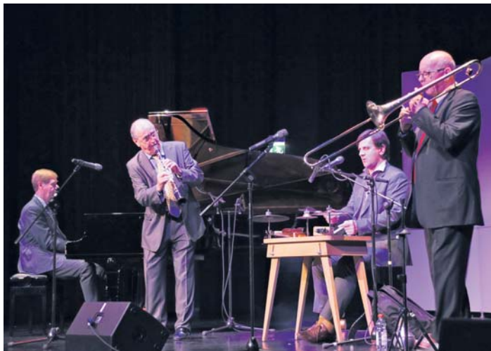
Ob allein oder als Quartett: Die vier Musiker von Paris Washboard verzauberten ihr Publikum. Am Ende ging sogar der Hocker für das Waschbrett in die Brüche.

Jazz mit „Paris Washboard“ begeistert Zuhörer im Bürgerhaus – Ein Waschbrett als Instrument