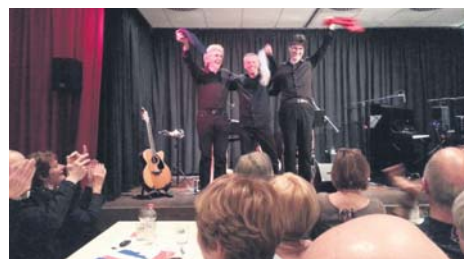
Französische Chansons mit „Les Voisins“ waren am 29. April im Gruppenraum 1 im Bürgerhaus zu hören.