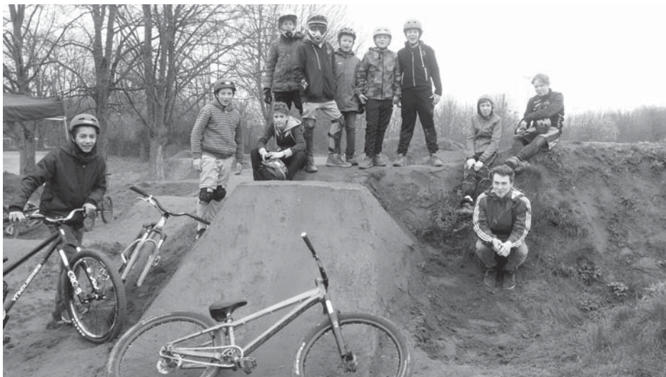
In Eigenarbeit richteten Jugendliche den Schwalbacher Dirtbike-Parcours in den Osterferien wieder her.