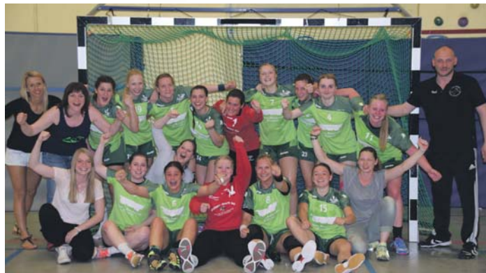
Die erfolgreichen Handballerinnen der FSG Vortanus gehen in der kommenden Saison in die Landesliga an den Start, nachdem sie sich in der Relegation durchgesetzt haben.

in die Landesliga. Bei der Relegation dominierten die FSG-Damen das Hinspiel nach Belieben und gewannen mit 40:31 Toren deutlich gegen die FSG Gettenau/Florstadt, sodass sie beruhigt zum Rückspiel in die Wetterau fahren konnten. Dieses verloren sie nach einem ausgeglichenen Spielverlauf in den letzten Minuten zwar knapp, aber durch das Polster aus dem Hinspiel war der Aufstieg trotzdem gesichert. Die mitgereiste Fan-Schar jubelte begeistert bereits vor Spielende, denn damit hatten die Damen das von ihnen selbst ausgetragene Saisonziel des Aufstiegs erreicht. red