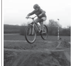
Mit viel Tempo fahren die Dirtbiker über die Erdhügel und heben ab.