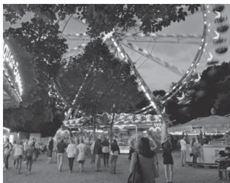
Ein Riesenrad mitten im Frankfurter Stadtwald