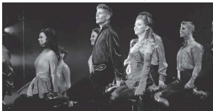
Die Tänzer von „Riverdance“ tanzen nahezu synchron.

Die Show ist am Donnerstag, 26. Mai im Kuppelsaal der Jahrhunderthalle zu sehen. Tickets sind auf der Seite www.ticketmaster.de erhältlich. red