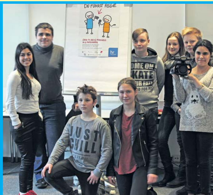
Insgesamt zehn Schüler der FES haben für den Video-Wettbewerb „Meine Ausbildung – du führst Regie!“ einen eigenen Film mit dem Titel „Whispering Voices“ gedreht.

Schwalbacher Jugendfilmprojekt wurde für einen Preis beim HR-Video-Wettbewerb nominiert