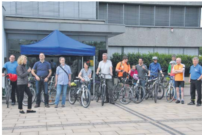
Die Aktion „Stadtradeln“ wurde am Samstag offiziell von Bürgermeisterin Christiane Augsburgs vor dem Rathaus gestartet. 13 Teams haben sich bisher angemeldet.

Insgesamt 13 Radler-Teams „stadtradeln“ für Schwalbach