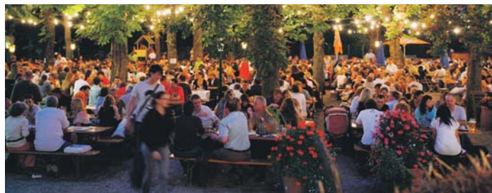
Auch in einem Biergarten kann es zu rechtlichen Problemen kommen.