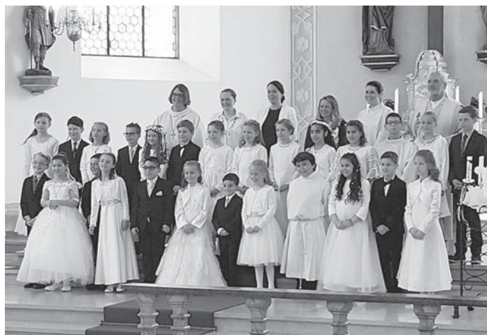
26 Jungen und Mädchen traten am Sonntag in weißen Kleidern und dunklen Anzügen zur Erstkommunion an den Altar von St. Pankratius.