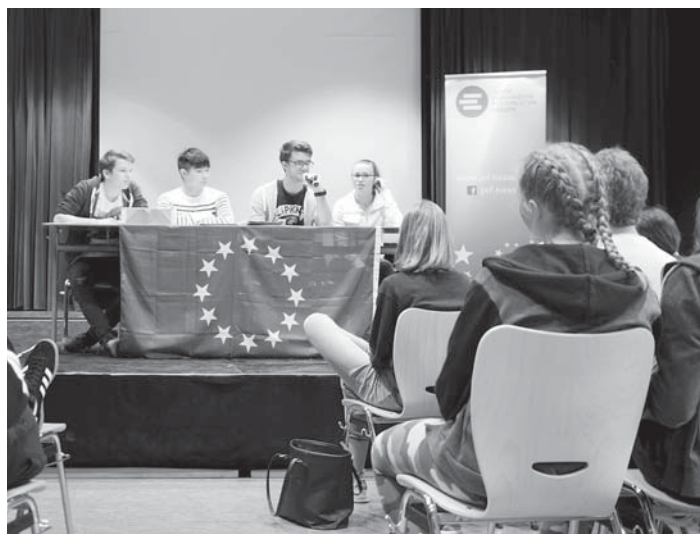
AES-Schüler stellten bei einem Projekt-Europatag die Präsidenten und Vizepräsidenten des europäischen Parlaments dar und simulierten Sitzungen und Verhandlungen.