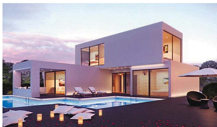
Der „D&L Clean Gebäudeservice“ reinigt sowohl Privatanwesen als auch gewerbliche Räume und Büros.

D&L Clean Gebäudeservice Inh.: Bilal Sönmez Daimlerstr. 6 61449 Steinbach Tel. 06171 / 9 51 80 41 Fax: 06171 / 9 51 80 42 Mobil: 0162 / 302 87 99 E-Mail: info@dlclean.de www.dlclean.de