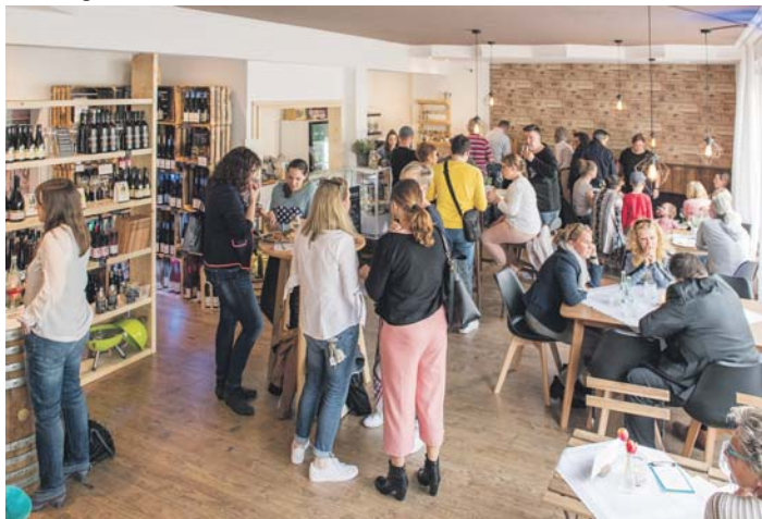
Viel los war beim zweiten „After Work Genuss“ am vergangenen Donnerstag in der „Genuss Botschaft“ in der Taunusstraße. Die Veranstaltung soll jetzt regelmäßig stattfinden.

„Die Genuss Botschaft“ in Alt-Schwalbach hat ihr Spezialitäten-Angebot noch einmal erweitert