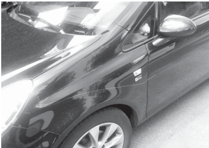
Tiefe Kratzspuren auf beiden Seiten fanden viele Bewohner der Taunusstraße am Sonntagmorgen an ihren Autos genauso vor wie Benachrichtigungen der Polizei.