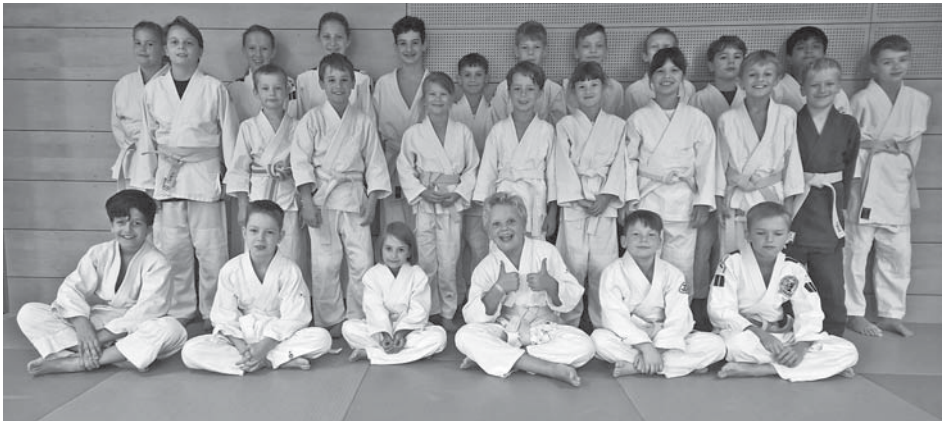
Bei der diesjährigen Judo-Safari der TG Schwalbach wurden viele Abzeichen vergeben.

Schwalbach am Taunus, 07.09.2017 gez. Marion Downing, Vorsitzende