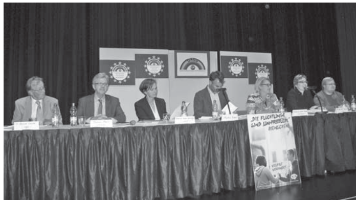
Europa stand im Mittelpunkt einer Podiumsdiskussion der DAGS im Bürgerhaus.