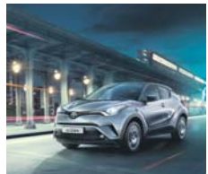
Eines der Hybrid Modellhighlights auf der Herbstsonderschau des Autohaus Nix am Samstag ist das SUV-Coupé „Toyota C-HR“.

Unter dem Motto „Anders fahren. Besser sparen.“ lädt das Autohaus Nix zum „E-Test Drive“ im Rahmen der „Tour der Wahrheit“ ein. Ein „E-Test-Gerät“ zeichnet die wichtigsten