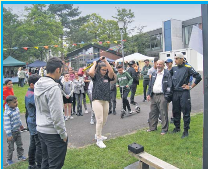
Zum Programm des Sommerfestes auf der Wiese vor dem Atrium gehörte am Freitag auch ein „Hau den Lukas“. Das Fest sollte Flüchtlinge und Schwalbacher zusammenbringen.

Mittwoch, 13. September: Bilderbuchnachmittag mit „Supadupa-Schwein“ um 15.15 Uhr. Fortsetzung auf Seite 3