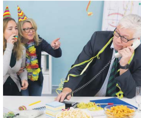
Nicht jeder Chef hat Verständnis für das bunte Treiben. Wer also verkleidet zur Arbeit erscheinen möchte, sollte das grundsätzlich mit seinem Vorgesetzten klären.