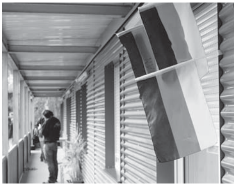
Auch nach Schwalbach, wie hier in die Flüchtlingsunterkunft am Westring, kamen nach Angaben des Main-Taunus-Kreises in den vergangenen Wochen immer weniger Flüchtlinge.

Nach einem Schlüssel auf Basis von Einwohnerzahl und Ausländeranteil werden die neu Ankommenden auf die Kommunen verteilt. Der Masterplan für die Unterkünfte des Kreises wird derzeit überar-