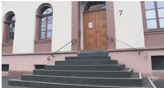
Acht steile Stufen führen zum Eingang des Hauses der Vereine in der Schulstraße.

Kaufe hochwertige Damen-/Herrenbekleidung (auch Mäntel/Jacken), Leder- und Abendgarderobe. Tel. 0157/38034511