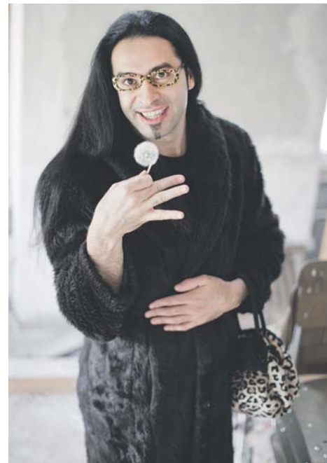
Der Mannheimer Comedian Bülent Ceylan hält die Menschen für „kronk“ und erklärt, warum sie dringend auf humoristische Behandlung angewiesen sind.

für den Auftritt in der Jahrhunderthalle. Wer gewinnen will, muss bis Montag, 13. Februar, eine E-Mail mit dem Betreff „Bülent Ceylan“ und einer vollständigen Adresse an verlosung@schwalbacher-zeitung.de senden. Die Gewinner werden schriftlich benachrichtigt. red