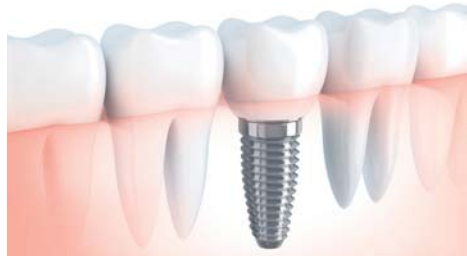
Fest im Kiefer verankerte Zahnimplantate sind eine komfortable Alternative zu konventionellem Zahnersatz. red

Der Eintritt zu den Vorträgen mit dem Thema „Feste Zähne an einem Tag“ ist kostenfrei. Es wird jedoch um Anmeldung unter 06122/6003 gebeten. pr