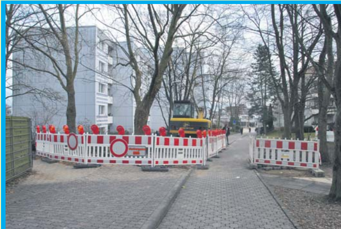
Gestern wurde am Mittelweg die Baustelle eingerichtet. In den kommenden zwei Wochen muss dort auf einer Länge von 60 Metern eine neue Wasserleitung verlegt werden.

Mittwoch, 15. Februar: Bilderbuchnachmittag mit „Kleine Nachtkatze“ um 15.15 Uhr.