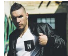
Rapper Fler.

ar tritt Fler in der Batschkapp auf und weckt somit das Fieber von vielen seiner Fans. Tickets können im Internet unter eventim.de zum Preis ab 20,95 Euro bestellt werden. red