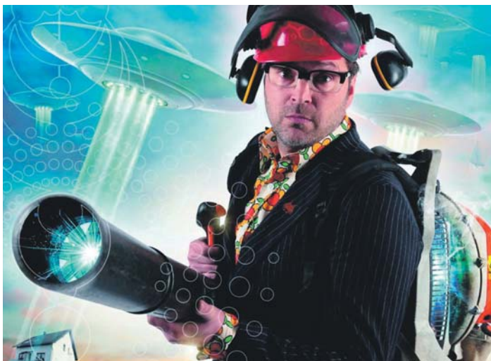
Das Plakat zu Paul Panzers aktuellen Programm „Invasion der Verrückten“.

Paul Panzer ist mit seinem Live-Programm am 10. Februar in der Jahrhunderthalle zu Gast