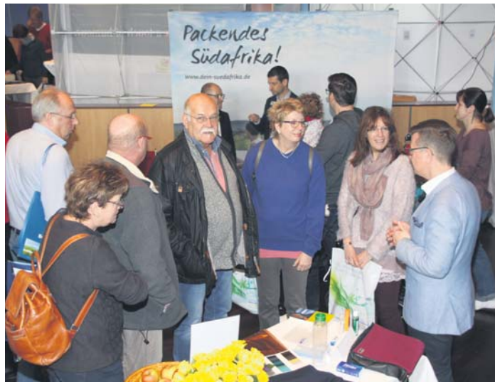
Fachkundige Beratungsteams beantworteten sämtliche Fragen rund um das Thema Reisen. Die „Kopp-Reisemesse“ soll nun jedes Jahr im Bürgerhaus stattfinden.

Kopp-Reisemesse: 30 Reiseunternehmen lockten nahezu 2.000 Besucher ins Bürgerhaus