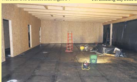
Noch müssen sich die Kinder der Kita „Schwalbennest“ gedulden. Ihre neuen Räume befinden sich noch im Rohbau. Der Einzug ist erst im Sommer 2022 geplant.