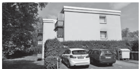
Die Grünen fürchten, dass „Am Erlenborn“ aus drei Stockwerken fünf Geschosse werden könnten.

Aufgrund der Systemumstellung der Finanzsoftware ist das Bürgerbüro am Donnerstag, 30. Dezember lediglich bis 12 Uhr geöffnet. An allen anderen Tagen bleiben die Öffnungszeiten der Stadtverwaltung unverändert. Am 24. und am 31. Dezember 2021 sind Bürgerbüro und Rathaus jedoch geschlossen. red