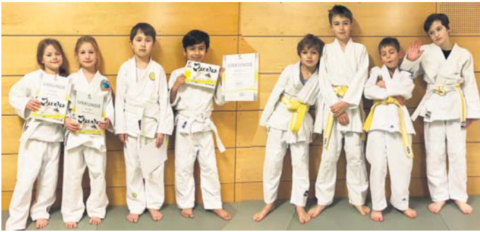
Die Judo-Anfänger der TG Schwalbach stellten Anfang Dezember ihr Können unter Beweis und freuten sich über ihre ersten Gürtel.

Nachwuchs-Judokas der TGS erfolgreich auf der Matte – Erste Prüfung für die Anfänger