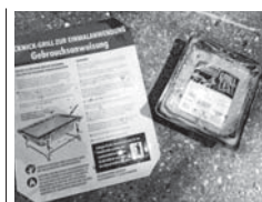
Beim Grillplatz im Europa-Park erwecken „ungeöffnete Plastikverpackungen mit Hähnchenkeulen Salmonellen zum Leben“. Der Mülleimer hingegen bleibt leer.

Schaut man auf die zurückgelassenen „Zivilisations-Artefakte“, wie sie sich dort zeigen, muss man sich allerdings sehr wundern. Da liegen auf dem „Esstisch“ verkokelte Essens- und nicht ordentlich entsorgte Grillkohlenreste. Auch auf dem um-