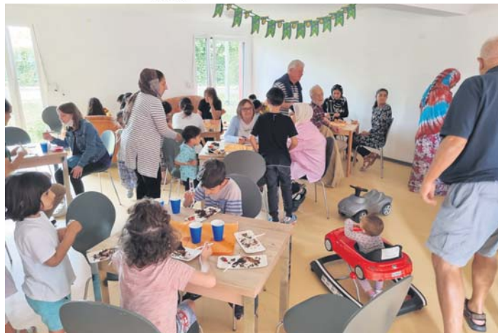
Für die zum Teil gerade erst eingezogenen Bewohner der Flüchtlingsunterkunft „Am Erlenborn“ war das Begegnungscafé eine gute Gelegenheit die Mitbewohner kennenzulernen.

Nur wenige Schwalbacher kamen zum ersten Begegnungscafé der Flüchtlingshilfe