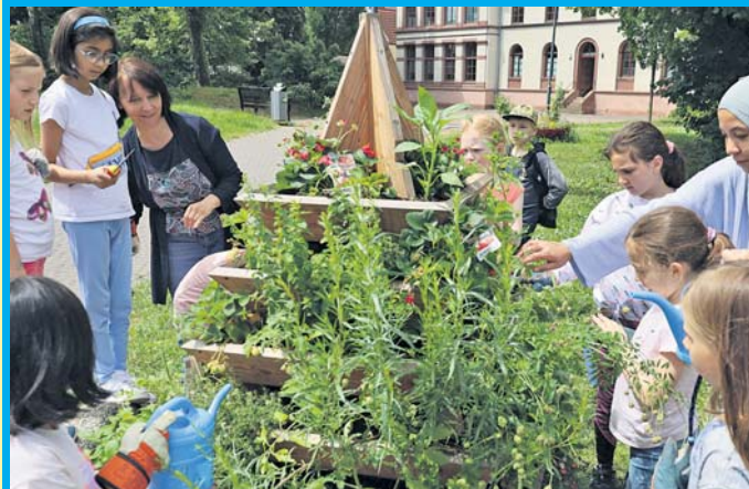
Auch eine Gruppe des Schulkinderhauses Geschwister-Scholl-Schule II bepflanzt die Gemüsepyramide in der Sauererlenstraße.