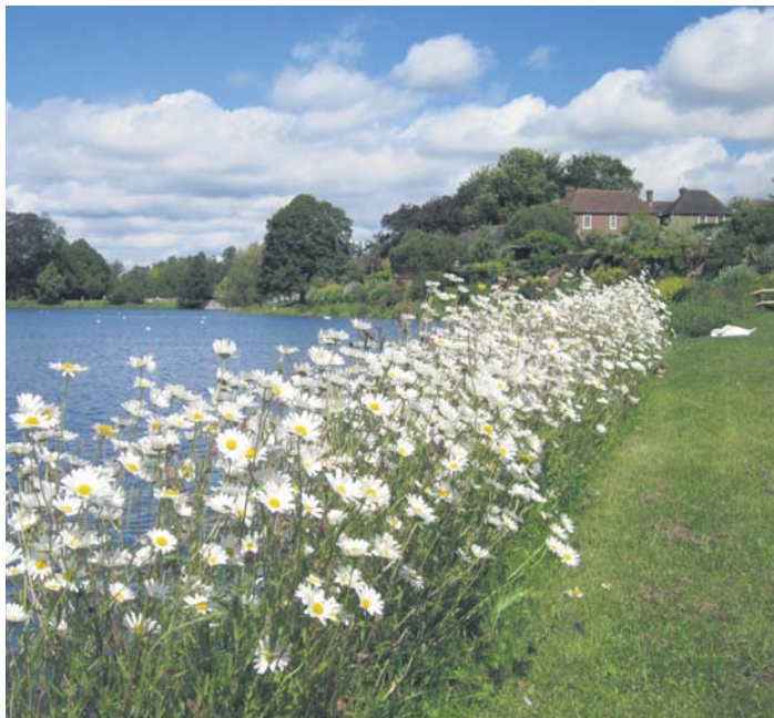
Gartenräume im Süden Englands. Am Donnerstag, 9. Juni, lädt der Arbeitskreis Yarm zu einem Vortrag „Gartenräume im Süden Englands: Sissinghurst, Hever, Sheffield, Leeds“ mit Dr. Gerhild Komander ein. Beginn ist um 19.30 Uhr im Raum 7+8 im Bürgerhaus. Die Gärten von Hever Castle, der Park von Sheffield Gardens und das Märchenschloss Leeds Castle wecken Gartenräume und Gärtnerlust. Der Eintritt ist frei.

„Sofatutor“ und „Schüler Duden Online“ gibt es jetzt kostenlos über die Stadtbücherei