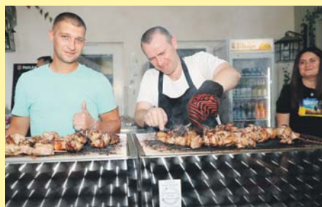
Das original ukrainische Schaschlik, das die bei „Mutter Krauss“ untergebrachten Flüchtlinge im Biergarten des derzeit geschlossenen Restaurants servierten, war einer der Renner auf dem Altstadtfest. Schon nach kurzer Zeit war der Stand ausverkauft.

Die meisten freuten sich über die außerordentlich entspannte und friedliche Atmosphäre auf dem Fest. Ein Besucher sagte: „Von mir aus könnte jeden Tag Altstadtfest sein.“ MS