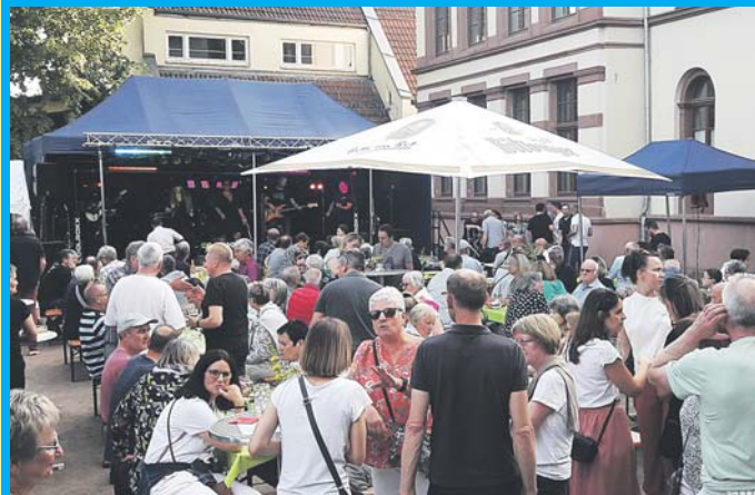
Dichtes Gedränge herrschte am Freitagabend vor der Hauptbühne an der alten Schule, wo die Band „CoolRox“ spielte und mit gefälligen Pop- und Rocksongs unterhielt.

Der Teilnahmebeitrag für den Workshop beträgt 10 Euro, Anmeldeschluss ist am 18. Juli. Es stehen höchstens 15 Plätze zur Verfügung. Weitere Informationen gibt es beim Jugendbildungswerk per E-Mail an jugendbildungswerk@schwalbach.de oder unter der Telefonnummer 06196/804-243. red