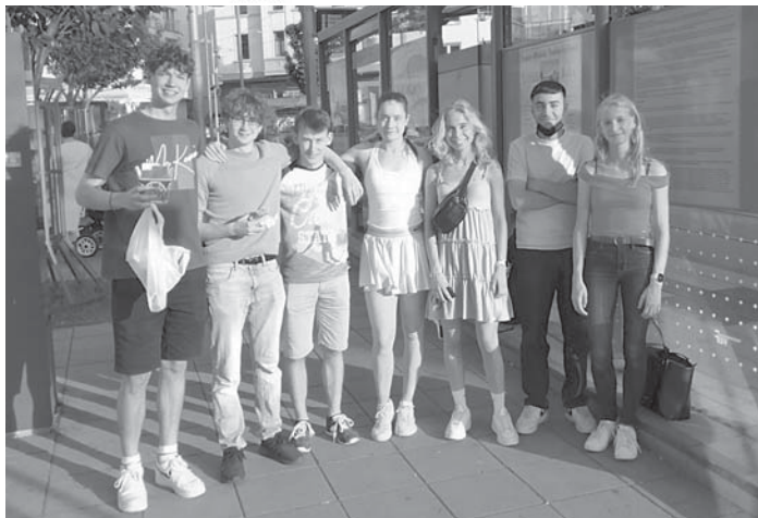
Viel Spaß hatten sieben Oberstufenschülerinnen und -schüler im „Megalomania“-Theater.

Oberstufenkurs Latein besuchte ein römisches Theaterstück im „Megalomania“-Theater