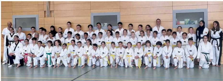
62 Teilnehmerinnen und Teilnehmer absolvierten die Taekwondo-Prüfung der TG Schwalbach erfolgreich.