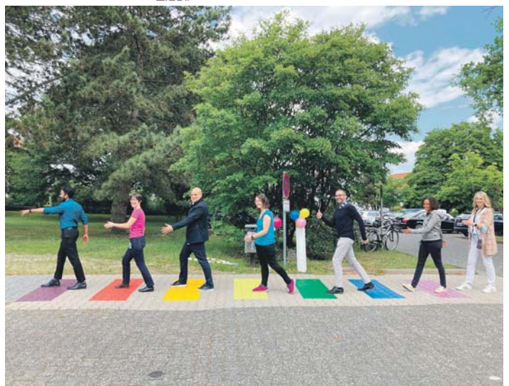
Auch am „Procter & Gamble“-Standort in der Sulzbacher Straße wurden sogenannte „Rainbow-Walks“ eröffnet, um einen Impuls für Chancengleichheit und Inklusion zu setzen.

Bunte Zebrastreifen auf dem Firmengelände als sichtbares Zeichen für Gleichstellung und Inklusion