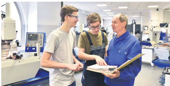
Bei den Praktikumswochen können Jugendliche ab der achten Klasse oder ab 15 Jahren einen Tag lang unkompliziert in einen Betrieb „schnuppern“.