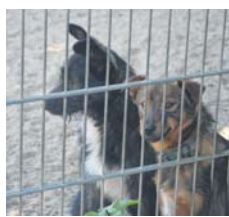
Wer auf der Suche nach dem passenden Hund ist, sollte als erstes im örtlichen Tierheim nachfragen.

Auch wer den Wunsch nach einem Rassehund oder Welpen hat, kann im Tierheim fündig werden. Paradoxerweise warten gerade Rassehunde länger auf eine Vermittlung, weil sie