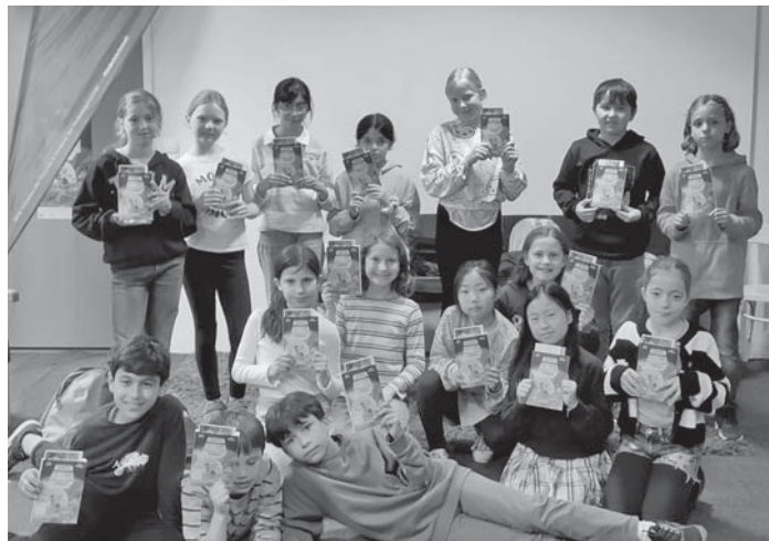
Die Igelklasse der Geschwister-Scholl-Schule freute sich über die geschenkten Bücher.

Mehr Informationen finden Sie auch im Internet unter www.nak-schwalbach.de