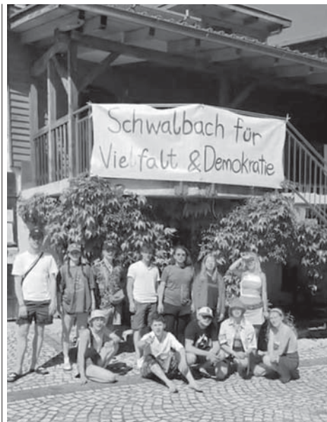
Die „Wilde Rose“ und der BDP trafen sich am vergangenen Wochenende zu einem traditionellen, internationalen Singetreffen in Lützensömmern in Thüringen.

Die erstmals vertretenen Jugendlichen aus Georgien brachten auch politische Diskussionen ins Spiel. Dabei konnten auch die Schwalbacherinnen und Schwalbacher mitreden, die ein selbstgezeichnetes Banner mitgebracht hatten und von der Demonstration „Für Vielfalt und Demokratie und gegen Ras-