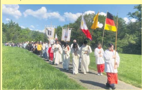
Am vergangenen Christi-Himmelfahrts-Donnerstag führte die deutsch-philippinische Prozession vom Gemeindehaus in der Badener Straße über den Bildstock nach St. Pankratius.

Nach der Messe trafen sich dann alle zum fröhlichen Beisammensein im Pfarrzentrum. Es gab leckere asiatische Spezialitäten. Die Filipinas hatten schon seit Tagen dafür gekocht. Für manche Schwalbacher war das auch eine neue kulinarische Erfahrung. Insgesamt fand der religiös-kulturelle Austausch große Anerkennung. red