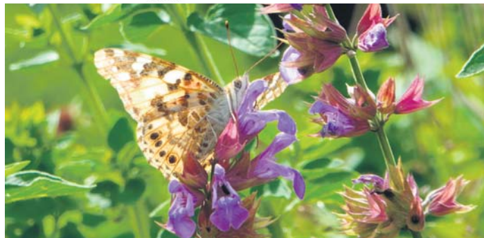
Bei den Führungen zur biologischen Vielfalt gibt es im Arboretum viel Natur zu entdecken, unter anderem kann auch der Distelfalter – wie hier auf einem Salbei – zu beobachten sein.

Weitere wichtige Tipps rund um die Aufnahme eines Tieres gibt es auf der „Tasso“-Webseite unter „Verantwortungsvolle Tierhaltung“. red