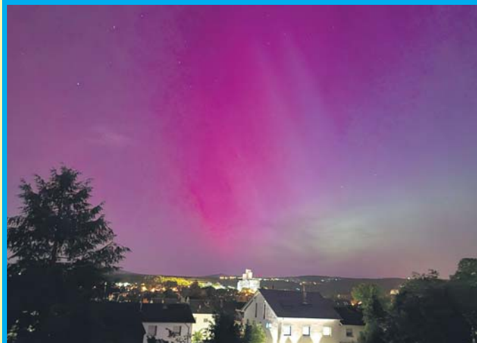
Polarlichter über Schwalbach. Auch am Schwalbacher Himmel konnte in der Nacht von Freitag auf Samstag das seltene Naturphänomen von Polarlichtern beobachtet werden. Durch die derzeit besonders starke Sonnenaktivität leuchtete der Himmel gegen 0.30 Uhr violett und grün auf. Normalerweise sind Nord- oder Polarlichter nur in Gegenden nördlich des Polarkreises zu sehen.