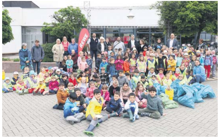
Nach der Müllsammel-Aktion trafen sich die Kinder auf dem Marktplatz.