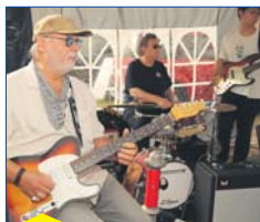
Besonders viel Publikum zog das „BluesHaus Bad Soden“ am Historischen Rathaus an.