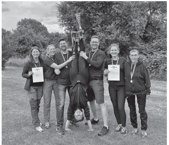
Das „A-Team“ der Hundefreunde Schwalbach freut sich über den dritten Platz beim regionalen Agility-Turnierfinale, das in Schwalbach stattfand.

Gelungenes Turnier der Hundefreunde Schwalbach auf ihrem Gelände am Kronberger Hang