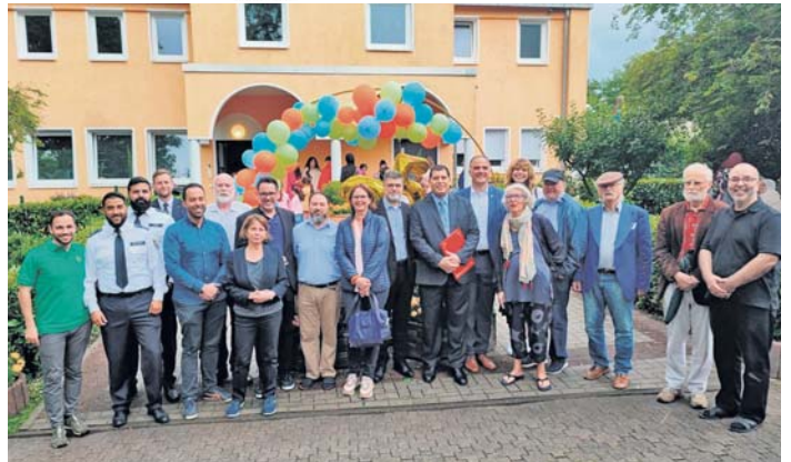
Viele Besucherinnen und Besucher kamen zum Jubiläum des Marokkanischen Kulturvereins.

Wir kaufen Wohnmobile + Wohnwagen 039 44 - 3 61 60 www.wm-aw.de Fa.