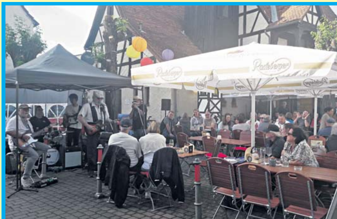
Fête de la musique. Der Platz vor dem Historischen Rathaus war am vergangenen Freitag so etwas wie das inoffizielle Zentrum des diesjährigen „Fête de la musique“ mit 15 Auftritten von Musikerinnen und Musikern, die über die ganze Stadt verteilt spielten. Mehr dazu auf Seite 5.

Die Genossenschaft „SolarInvest“ will ein Carsharing-Projekt in Schwalbach verwirklichen