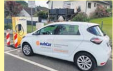
So sieht die „nahCar“-Station in Fischbach aus.