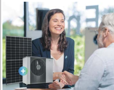
In seinen neuen Räumen in Schwalbach beraten die Expertinnen und Experten von MVV zu erneuerbaren Energien.

Um Anmeldung unter mvv.de/schwalbach im Internet wird gebeten. Auch Kurzentschlossene sind aber herzlich willkommen. red