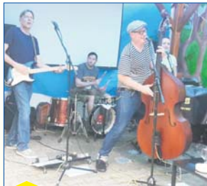
In der Kult-Eiche spielen „The Tulips“ klassischen Rock'n'Roll.