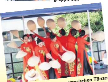
Anmutig tanzten die vietnamesischen Tänzerinnen in ihren traditionellen bunten Gewändern über die Bühne auf dem Marktplatz.

Viele hundert Besucherinnen und Besucher kamen am Sonntag zum interkulturellen Marktplatzfest und zum verkaufsoffenen Sonntag.