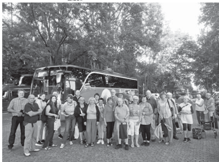
Müde, aber glücklich erreichten die Gäste aus Olkusz am Mittwochabend Schwalbach und wurden von Mitgliedern des Arbeitskreis Olkusz und ihren Gastfamilien in Empfang genommen.

Tai Fu Schulungszentrum Marktplatz 7 (Eingang Avestraße) Telefon 06196 - 5614626 www.tai-fu.de kontakt@tai-fu.de