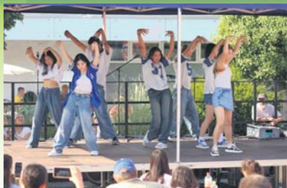
Jugendlichen Schwing brachte die K-Pop-Gruppe auf den Marktplatz.