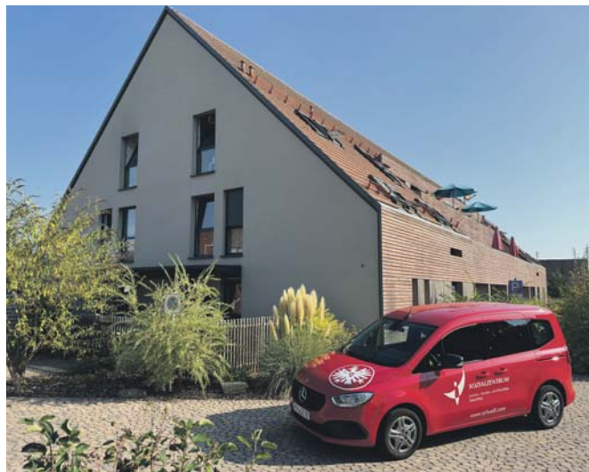
Da schlägt das Herz der fußballbegeisterten Senioren höher.... Unseren Gästen stehen für den Transport seit Neuestem zwei Fahrzeuge zur Verfügung, die im Sinne der Eintracht Frankfurt gestaltet sind.

Gäste der Tagespflege des Sozialzentrums sind im Herzen von Europa unterwegs