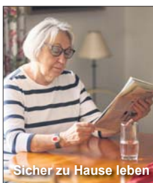
Sicher zu Hause leben