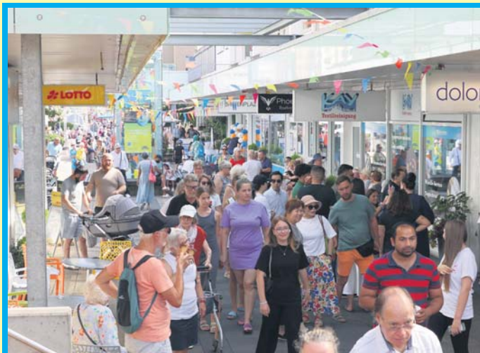
Heiße Tänze auf dem Marktplatz. Viele hundert Besucherinnen und Besucher kamen am Sonntag zum Interkulturellen Marktplatzfest und zum verkaufsoffenen Sonntag. Es war mit Temperaturen über 30 Grad eines der heißesten Marktplatzfeste seit langem. Trotzdem drängelten sich die Menschen in der Einkaufspassage. Mehr dazu lesen Sie auf Seite 5.

Mittwoch, 11. September: Treffpunkt Lesetreppe mit einer Überraschungsgeschichte zum Thema Freundschaft um 15.15 Uhr in der Stadtbücherei.