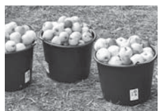
Bei der Apfelernte im Arboretum gibt es je zwei gesammelte Eimer Obst eine Flasche Most gratis.

Die Obstbäume im Arboretum tragen auch in diesem Jahr wieder viele Früchte. Groß und Klein sind deshalb eingeladen, Apfel und Birnen auf der Streuobstwiese des Waldparks zu sammeln. In einer mobilen Kelteranlage werden die Früchte vor Ort gepresst und der frische süße Saft kann nach dem Abfüllen in Flaschen direkt verkostet werden. Je zwei gesammelte Eimer Obst gibt es eine Flasche Most gratis. Zusätzlich Flaschen können gekauft