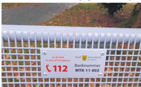
Alle 300 Ruhebänke im Schwalbacher Stadtgebiet tragen nun diese Notfalltafeln. Durch die einzelnen Banknummern kann schnelle Hilfe im Notfall gewährleistet werden.

Genießen Sie Ihre Terrasse auch bei Wind und Wetter. Mit weinor Terrassendächern! Markisen Terrassendächer Glasöasen® Alfred Müller GmbH & Co. KG Taunusstraße 7 · 65824 Schwalbach a. Ta. Tel. 06196 14 83 · Fax 06196 81407 E-Mail: stefan.mueller@mueller-schwalbach.de