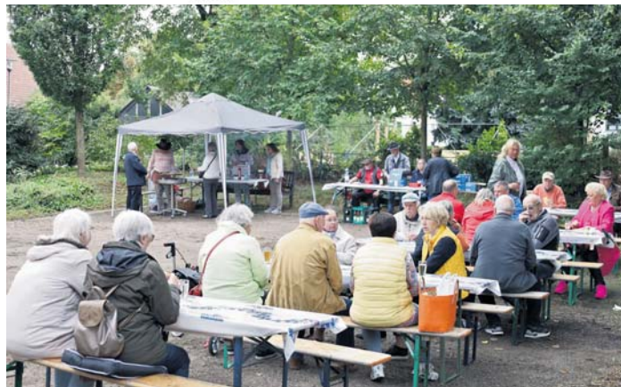
Schnell füllten sich die Tische und Bänke hinter der alten Schule beim Grillnachmittag des Schwalbacher Seniorenbeirats, der am vergangenen Freitag bei kühlen Temperaturen stattfand.

Es beginnt am Sonntag, 22. September, um 15 Uhr in der Eichendorff-Anlage. Wie gewohnt wird es dabei auch dieses Jahr für Kinder wieder die Möglichkeit geben mit dem Pony zu reiten und Stockbrot am offenen Feuer zu backen. Mit Kaffee, einem umfangreichen Kuchenbuffet sowie Wein und nicht-alkoholischen Getränken ist für das leibliche Wohl der großen und kleinen Besucherinnen und Besucher gesorgt. red