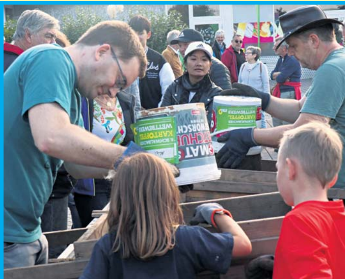
Erfolgreiche Kartoffelzüchter. Bei schönstem Wetter fand am Sonntag der Erntetag des diesjährigen Kartoffelwettbewerbs der Schwalbacher Grünen auf dem Schwalbacher Marktplatz statt. Im Eimer der Siegerin waren am Ende mehr als 1.100 Gramm. Die meisten Teilnehmer brachten Eimer mit 400 bis 500 Gramm. Mehr dazu lesen Sie auf Seite 3.

Pelze aller Art, Nähmaschinen, Schreibmaschinen, Figuren, Porzellan, Schallplatten, Eisenbahn, Leder- und Krokotschen, Silberbesteck, Bleikristall, Zinn, Modeschmuck, Möbel, Kleider, Alt- und Bruchgold, Zahngold, Goldschmuck, Gardinen, Uhren, Münzen, Bernstein, Perlen, Bilder, Gobelin, Messing, Teppiche, Orden, Ferngläser, Puppen, Perücken, Krüge, komplette Nachlässe sowie Haushaltsaufösungen. Kostenlose Besichtigung sowie Wertschätzung, 100% seriös und diskret, Barabwicklung vor Ort, Mo. - So. von 8-21 Uhr ☎ 0 61 96 / 40 26 889